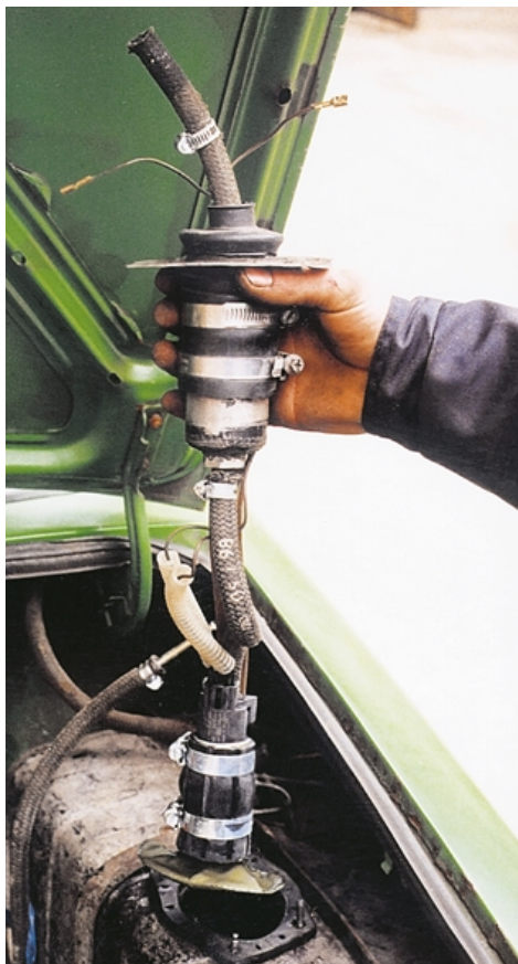
Так установлен бензонасос в обычном «жигулевском» баке.

Правда, этим переделки не ограничились. Заманчиво было узнать, как повлияет впрыск на работу двигателя на самых высоких частотах вра-