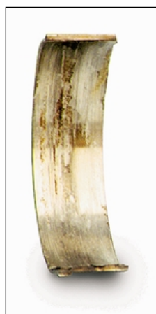
«Убитый» шатунный вкладыш – типичная причина стука под нагрузкой.

Для чего мы приводим подобные примеры? Чтобы попытаться объяснить: помимо характера стука и его изменения в зависимости от режима работы двигателя правильно определить причину стука помогает анализ обстоятельств, при которых он впервые появился.