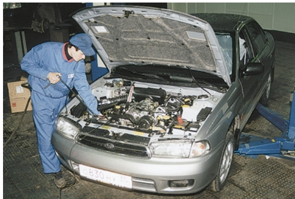
Грамотная эксплуатация и квалифицированное техобслуживание — главные условия высокого ресурса двигателя.

С маслом связано еще больше неприятностей. Проблемы начинаются, как правило, от мелочности, желания сэкономить и залить то масло, что подешевле. А там уж как повезет — может, обойдется, а может, и нет. Прямо — русская рулетка. Двигатели старых конструкций подобное, скорее всего, переживут, хотя и не без ущерба для своей долговечности. Зато новые, особенно с наддувом — вряд ли.