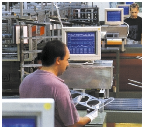
Современные технологии производства — еще одно слагаемое долговечности двигателя.

В качестве одного из примеров рассмотрим влияние мощностных характеристик на ресурс двигателя. Очевидно, чем меньше оборотов ко-