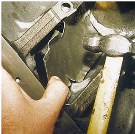
...и внутри блока.