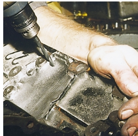
Далее сверлятся отверстия и нарезается резьба.

катора тоже ничего не получится — затвердевшая смола треснет, поскольку блок цилиндров постоянно испытывает циклы нагрева-охлаждения, приводящие к опасным для смолы напряжениям. Да и другие свойства «эпоксидки» — низкая механическая прочность и не слишком хорошая адгезия (прочность соединения с металлом) делают ее практически непригодной для ремонта блоков.