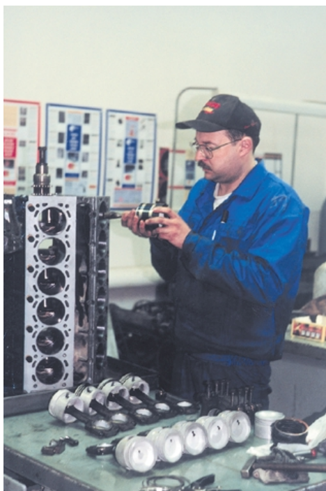
Собрать двенадцатицилиндровый мотор — задача не одного дня.