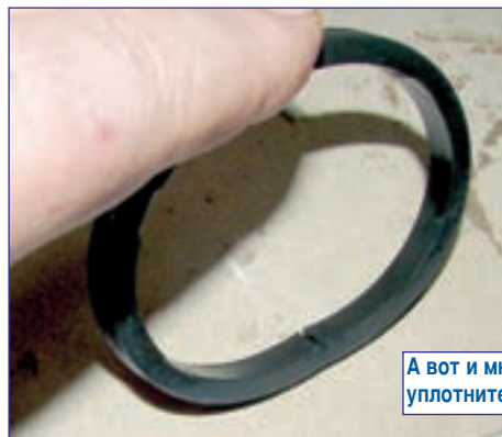
А вот и мнимый «виновник происшествия» — надорванное уплотнительное кольцо масляного фильтра.

Этот пример наглядно показывает, что повальная некомпетентность при проведении экспертизы неисправностей двигателей делает судебное разбирательство по таким претензиям сродни лотерее — если «повезло» с экспертом, то выиграешь, а если «не повезло», то проигра-