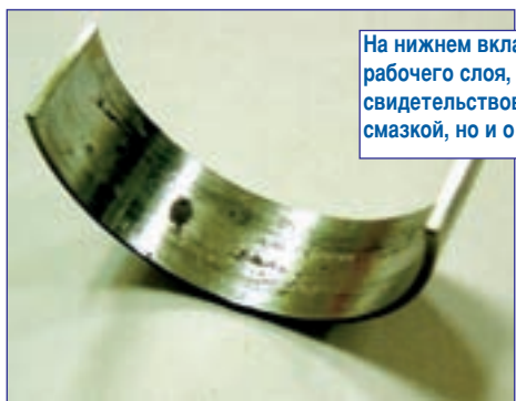
На нижнем вкладыше хорошо видны зоны усталостного разрушения рабочего слоя, отсутствующие на верхнем вкладыше, что может свидетельствовать не только о работе двигателя с недостаточной смазкой, но и о дефекте производственного характера.

Вообще необходимо отметить, что дефекты производственного характера — довольно редкая «птица» в массовом автомобилестроении. Когда производство предельно автоматизировано, роль «человеческого фактора» сведена к минимуму, и вероятность подобных случаев довольно низкая. И если дефекты, связанные непосредственно с процессом механической обработки деталей, нет-нет да и встречаются, то дефекты, имеющие конструктивный харак-