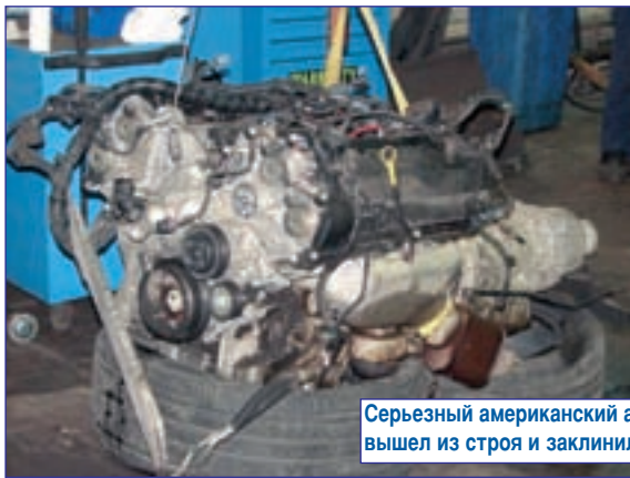
Серьезный американский агрегат, как оказалось впоследствии, вышел из строя и заклинил из-за дефекта «копеечной» детали.

К сожалению, необходимо отметить, что именно такая «экспертиза» сегодня «правит бал» в судах. Почему? Потому что, открыв любое из подобных заключений, вы обязательно найдете указание на то, что данный эксперт-трасолог имеет «стаж работы по специальности судебного эксперта с 198...», а то и «с 197... года». И именно его мнению будет оказано самое высокое доверие. Но