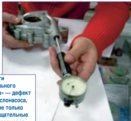
Чтобы найти действительного «виновника» — дефект корпуса маслососа, пришлось не только провести тщательные измерения размеров деталей...

ешь. И наоборот — при «независимости» решения суда от реальной причины неисправности и сильной зависимости от компетентности эксперта. Точнее, от его некомпетентности.