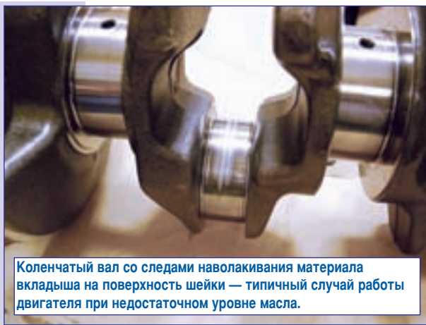
Коленчатый вал со следами наволакивания материала вкладыша на поверхность шейки — типичный случай работы двигателя при недостаточном уровне масла.

Что, вообще говоря, должен сделать эксперт, исследуя неисправный двигатель? Очевидно, внимательно осмотреть все детали, сделать необходимые измерения, чтобы убедиться в наличии или, наоборот, отсутствии конкретных