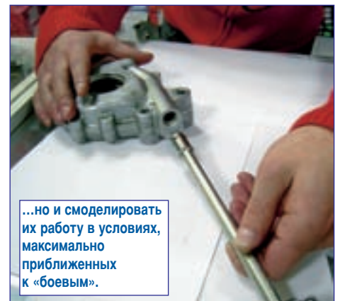
...но и смоделировать их работу в условиях, максимально приближенных к «боевым».

В этой связи необходимо заметить, что, к сожалению, при использовании экспертизы некоторыми дилерскими центрами иногда практикуется определенное лукавство. Создается даже впечатление, что иной техцентр, обраща-