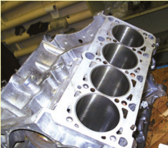
Неремонтируемый мотор на сборке — проблемы постепенно решаются.