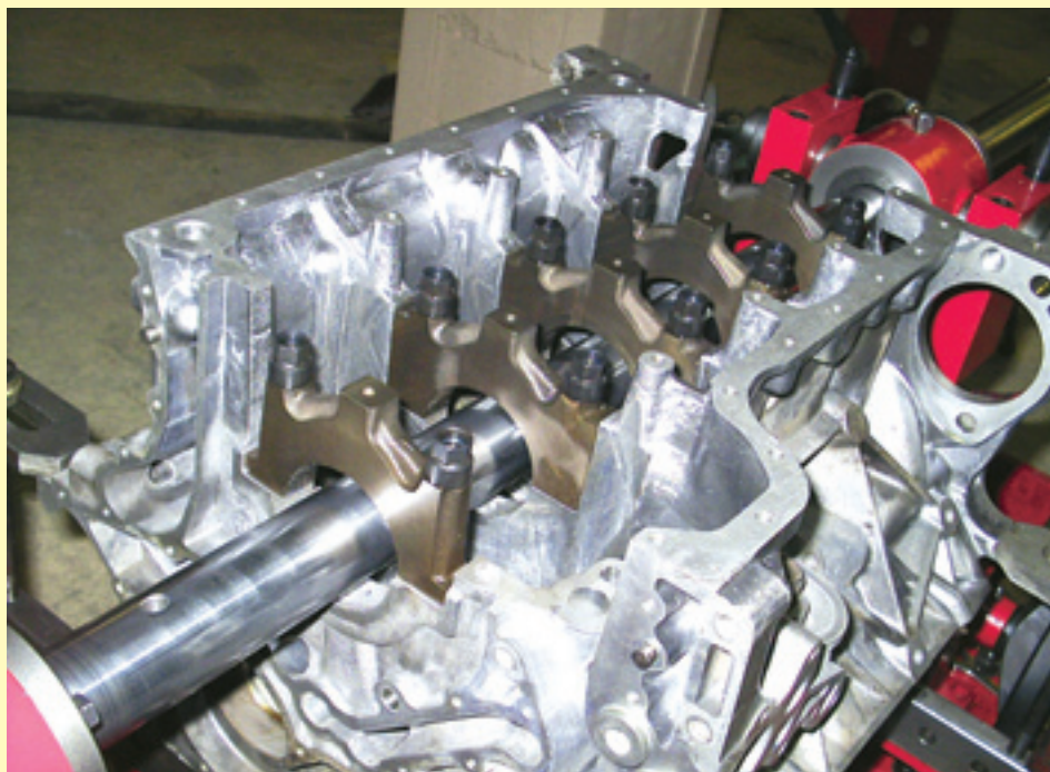
Расточка постелей — одна из самых ответственных процедур. Достаточно сделать ее по-быстрому, чтобы обречь мотор на быструю, но мучительную кончину.

К тому же настоящие правила не «мартыше-чьи», когда открой инструкцию и делай раз, делай два, а «шаг вправо-влево — расстрел». Наоборот, шагать изначально придется по довольно извилистой дорожке, и к этому надо быть готовым.