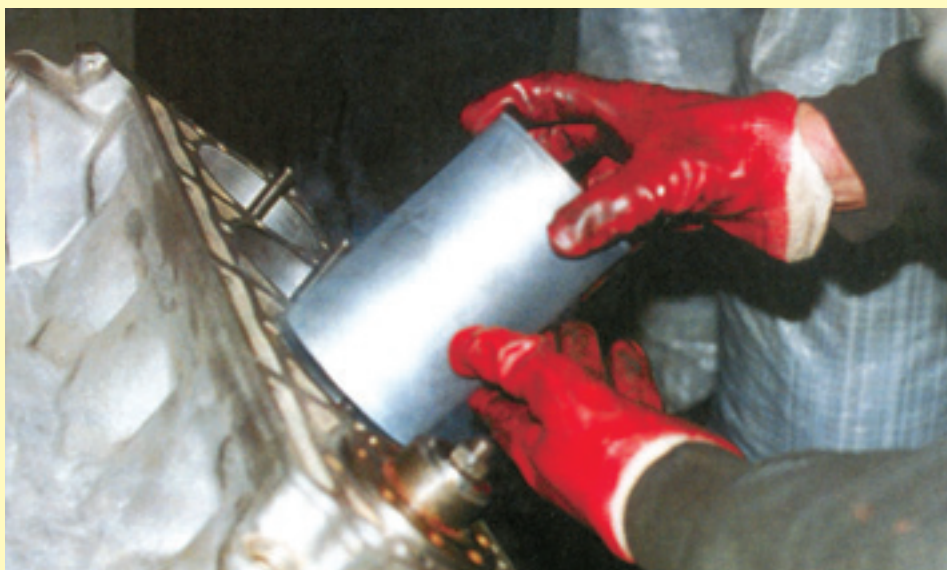
Гильзовка блока — самая ответственная операция. Она часто применяется при ремонте неремонтируемых моторов. Основной дефект — просадка гильз — прямое следствие скоростных и недорогих методов работы.

Такая позиция вполне устраивает и многие специализированные мастерские. В самом деле, зачем тратить деньги на хорошее оборудование, если качество никто не спрашивает? Тогда проще нанять побольше народу, и лучше таких, кому не надо много платить, вручить каждому какую-нибудь «крутилку-ковырялку» — и в бой.