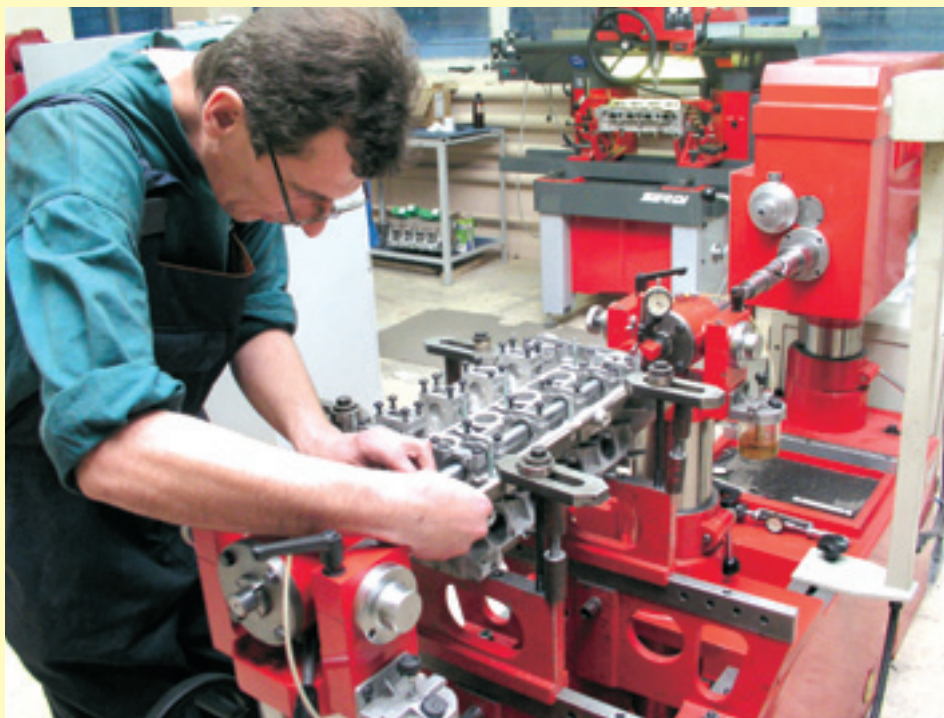
Для серьезного мотора применимо только серьезное оборудование.

Для коленчатых валов тоже можно кое-что упростить и удешевить — исключить, к примеру,