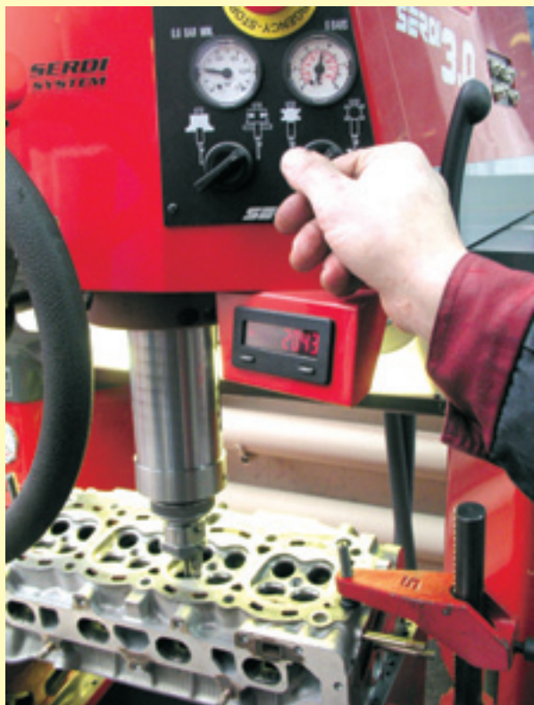
Хотят наши бравые ремонтники или нет, а использовать для обработки седел нормальные станки им скоро все равно придется.

из процесса полировку шеек. Да и зачем она нужна, если шейки просто сверкают, а размер в допуске? Но острые края смазочных отверстий «пошинкуют» вкладыши, что затем превратится в «плохие вкладыши» или «грязную сборку», в зависимости от того, кто кому потом будет предъявлять претензии.