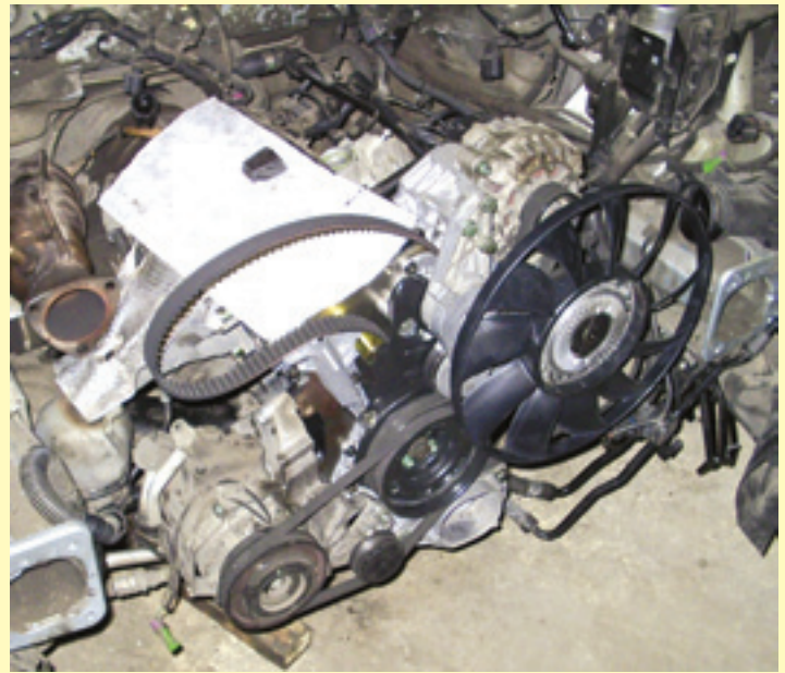
До запуска отремонтированного неремонтируемого остались считанные часы...