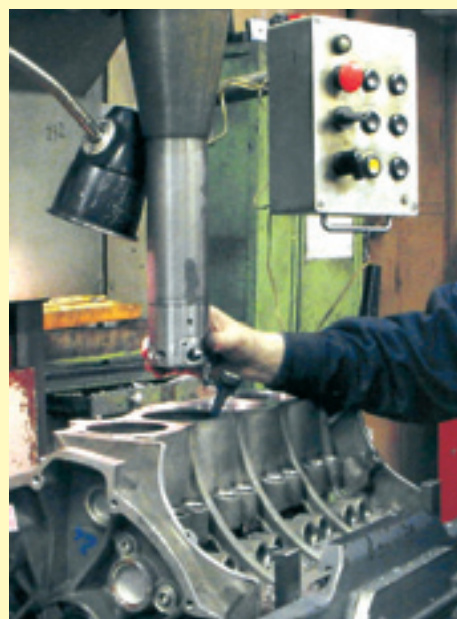
Можно было бы обойтись и без расточки, только такой двигатель, отремонтированный по упрощенно-удешевленной технологии, потом не «ходит».

Вот такие нехитрые правила. Заметим, что они в точности прямо противоположны тем при-