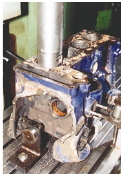
Осталось только расточить блок — качество работы обеспечено правильной технологией.

Где же выход? Да здесь же, под руками. Ведь если нельзя иначе, то почему бы не попробовать растачивать блок непосредственно от постели коленвала?