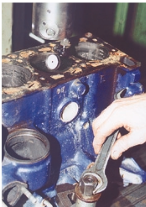
Поставив блок на скалку, необходимо отрегулировать положение блока в поперечном направлении.

по вертикали в двух направлениях — поперечном и продольном. При этом фактически исходят из того, что цилиндр не «косит», т.е. за базу выбирают, в конечном счете, образующую цилиндра.