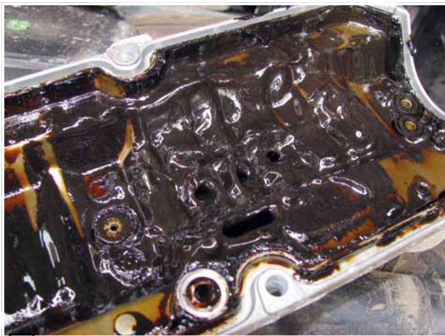
□ Он же — под клапанной крышкой

Ну, а если случился насморк, и вы все же заправились? Спасение одно — спохватившись, немедленно меняйте масло и бензин, промывайте двигатель, заправляйтесь проверенным маслом и топливом. Ситуацию можно отследить и по масляному щупу — если на нем висит загустевшая капля и стекать не хочет, ну чистая смола, срочно меняйте масло с промежуточной промывкой.