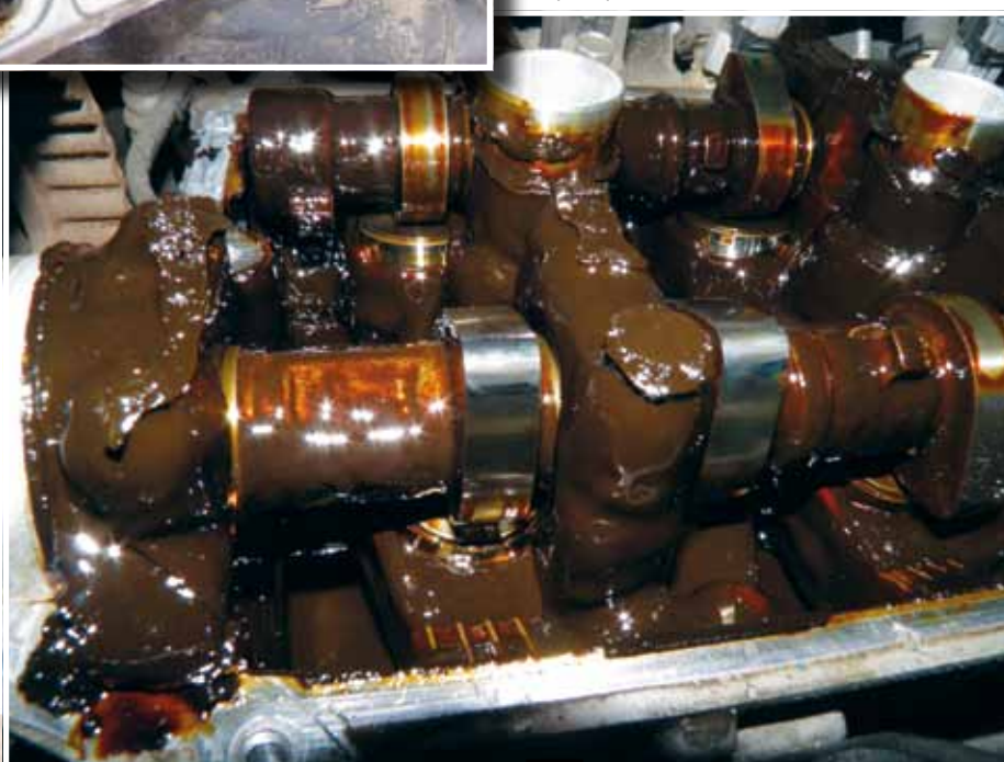
□ В головке блока видны только кулачки распределов и толкатели — все остальное скрыто под толстым слоем «гуталина»

И все же наши эксперты склоняются к версии кубовых. Кстати, при определенном навыке их на АЗС можно обнаружить — если хорошенько принюхаться. Запах кубовых описать трудно, но самый понятный бытовой аналог — аромат палтуса, зажаренного на прогорклом масле. Так вот, если вы заподозрили неладное, на такой АЗС лучше не заправляться.