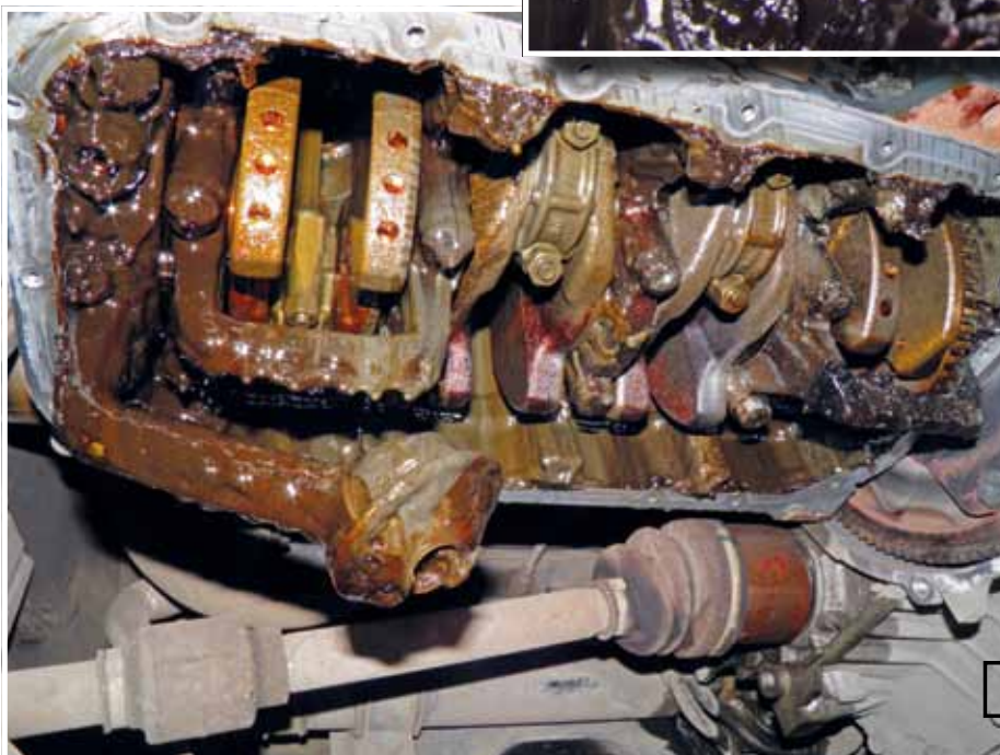
Снизу в двигателе на всех неподвижных деталях такой же «гуталин»

Ай да кубовые... Но есть еще одна версия. Как известно, готовая продукция любого предприятия строго контролируется. А вот с полуфабрикатами проще — они могут быть и с браком, да и от «усушки» с «утряской» вполне могут пострадать. В общем — свобода, в определенных пределах. Возможно, где-то на НПЗ кто-то ворует такой промежуточный продукт — крекинговые фракции, подвергнутые риформингу, но еще не прошедшие стадию