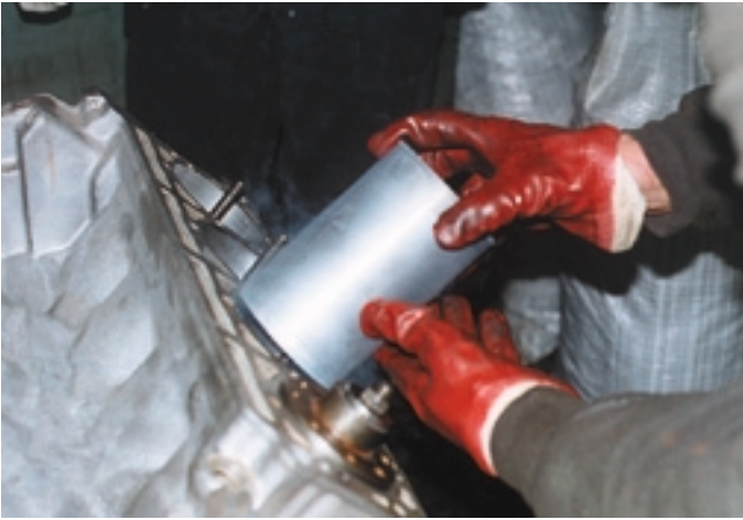
Чтобы установить гильзу, охлажденную в жидком азоте, в гнездо блока, никаких усилий не требуется.

поршня о стенки. Оптимальная величина натяга 0,04-0,06 мм. Меньший натяг ухудшит теплопередачу от поршня в охлаждающую жидкость, больший — приведет к чрезмерной деформации соседних цилиндров. В то же время при установке такой же гильзы в алюминиевый блок надо учитывать разницу в коэффициентах температурного расширения материалов: величину натяга следует увеличить до 0,06-0,07 мм, чтобы гильза не ослабла при нагреве блока. Напротив, мягкую алюминиевую гильзу в такой блок можно поставить с натягом всего 0,02-0,03 мм без какой-либо опасности ослабления посадки.